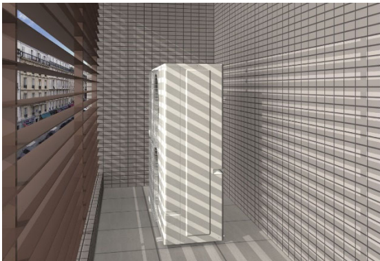
目隠しフェンスで覆われたバルコニーに設置した J-ⅢL(18HP) (イメージ図)

室外機の排熱口を縦吹き型から横吹き 2 ファン型に変更するとともに、独自の高密度熱交換器の搭載など構成部品の最適化を図り、室外機の奥行を 480mm に抑え、18HP クラスで業界最小 ※1 となるコンパクト室外機を実現しました。従来機種と比べても、設置面積で約 45%削減し、搬入時もエレベーターに載せ易くするなど、施工性の向上を図り、建物との間やバルコニーなどの狭小スペース、目隠しフェンスで覆われた場所など、直接目に触れない場所への設置が容易になりました。さらに、静圧は 60Pa までの送風抵抗に対応し、目隠しフェンスのある場所でも設置が可能です。これらにより、小規模店舗や事務所などで、設置レイアウトの選択肢が広がり、設備設計の自由度が高まります。