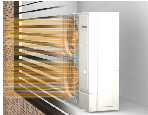
ファンから出る送風の抵抗に 60Pa まで対応しているため、目隠しフェンスで覆われていても性能が低下しにくい。

※1 2018年11月28日現在。当社調べ。18HPクラスにおいて。高さ 1,638mm×幅 1,080mm×奥行 480mm。