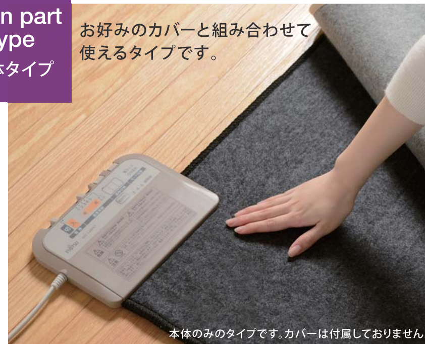
本体のみのタイプです。カバーは付属していません。