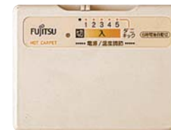
薄型コントローラー

オープン価格 カバーサイズ:185cm×115cm 本体サイズ:180cm×110cm カバー:アクリル100% 消費電力:305w