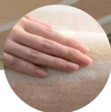
ふんわりぬくもり感あるボアタイプ

やさらかな曲線とアースカラーを組み合わせたデザインは身体にも心にも、ほっとするぬくもりを与えてくれます。ナチュラルな木の家具やフローリングとも調和しやすく優しい肌ざわりのボアタイプはお子さまにもおすすめ。