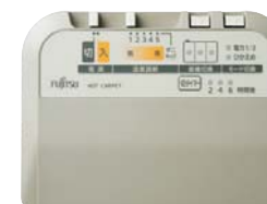
薄型コントローラー

オープン価格 サイズ:176cm×176cm 消費電力:510w/340w/170w