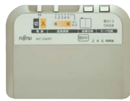
薄型コントローラー

オープン価格 カバーサイズ:180cm×180cm 本体サイズ:176cm×176cm カバー:ポリエステル100% 消費電力:520w/260w