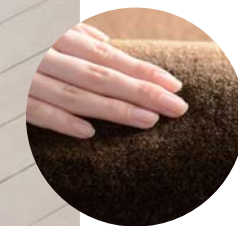
ナチュラルでやさしいメランジ調の風合い