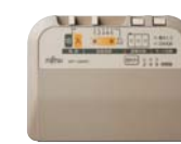
薄型コントローラー

カバーサイズ：180cm×180cm 本体サイズ：176cm×176cm カバー：ポリエステル100% 本 体：消費電力 510W/340W/170W